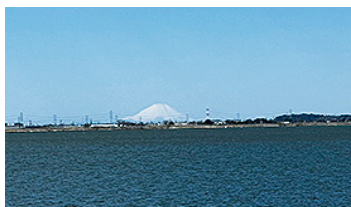
▲サイクリングロードから見える富士山(3月14日)