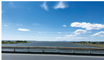
▲北利根橋からの霞ヶ浦(5月9日)