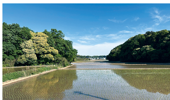
▲田植えを終えたばかりの田んぼ(5月5日)