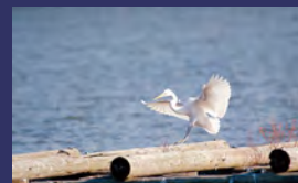
市の鳥 シラサギ（白鷺）