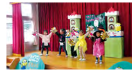
▲昨年度実施の様子

就学前のお子さんとの園児がふれあう場として、園開放を実施しています。公立幼稚園の教育活動に関心がある方や園舎・園庭を見学されたい方は、この機会にぜひご参加ください。