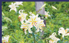
市の花 ヤマユリ（山百合）

行方市民憲章 やさしい自然 かがやく人 わたしたちがつくる 魅力あるまち、行方市