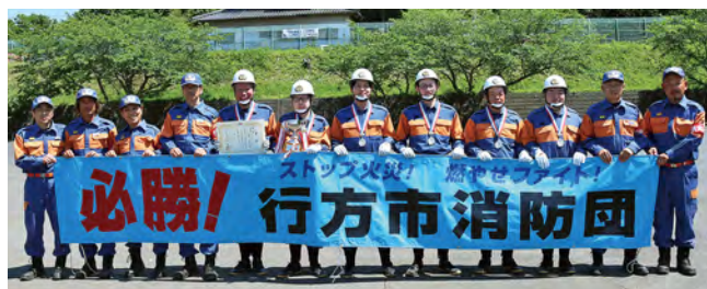
▲ 自動車ポンプの部優勝 繁昌消防団