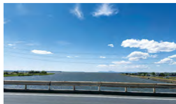
▲北利根橋からの鯉ヶ浦(5月9日)