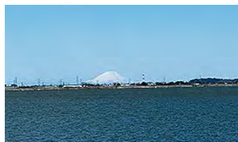
▲サイクリングロードから見える富士山(3月14日)