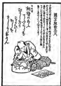
国字垣歌志久 「常陸常総の狂歌」より

町人文化（化政文化）が花開いた江戸の文化・文政期（1804～1830年）、上方（※1）で生まれた庶民の文芸「狂歌」が大流行しました。中でも国字垣歌志久（俳諧堂）は、江戸の花形狂歌師でした。本名を手賀弥太郎常幹（現行方市手賀（※2）出身）と言い、麻生藩新庄氏に仕える有能な武士でした。そのため、優美で繊細な作風を旨とする狂歌堂（鹿都部真顔）派に属し、卑俗な言葉で俗情を詠った六樹園（宿屋飯盛）派と対立していました。「櫛げずる柳の髪に梅が香をつけてとかしてむすぶ春風」など、国字垣は狂歌を俳諧歌（※3）と捉えた作風で、麻生地区を中心に国字垣連を設立し、隣接する潮来地域など霞ヶ浦北岸一帯に狂歌を広め、地方文化の発展に貢献しました。