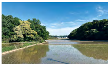
▲田植えを終えたばかりの田んぼ(5月5日)