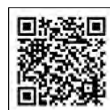
▲応募フォームはこちら

▶ 応募先 〒311-3892 行方市麻生1561-9 市報行方7月号懸賞係宛て