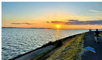
▲サイクリングロードでの夕焼け(5月11日)