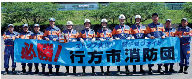
▲ 小型ポンプの部優勝 小貫消防団