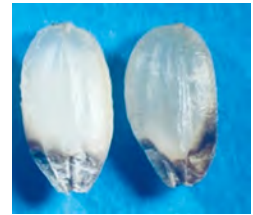
▲イネカメムシにより基部を加害した斑点米