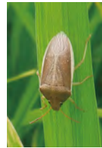
▲イネカメムシ (左:成虫、右:幼虫)

主食・加工用米は、②乳熟期防除がメイン、多発生時は、①出穂期防除を追加すること。