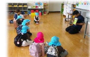
対話を楽しむサークルタイム