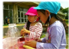
まるで実験！色水遊び