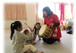
ミュージック・ケア♪