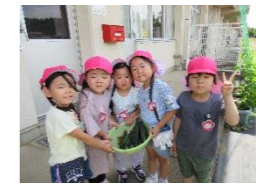
季節の野菜を収穫