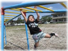
雲梯に挑戦 やってみよう！