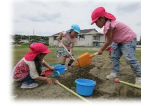
砂遊び 大きい山を作ろう！