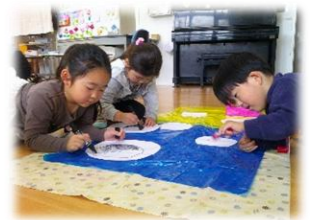
作るっておもしろい