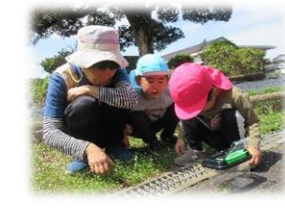
ダンゴムシを見つけたよ！