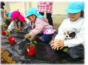
野菜を育ててみよう