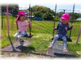
広い園庭でのびのびと外遊び！