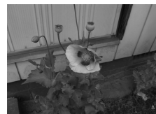
◀アツミゲシ (セティゲルム種)