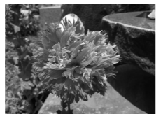
◀ケシ (ソムニフェルム種)