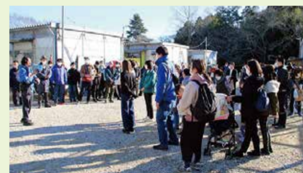
▲ボランティアエキストラ参加の様子