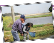
「思い出フォト」 曾祖父と一緒に魚を 取っている写真です。