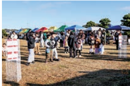
▲ 行方市農業クイズ大会を実施