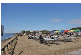
▲ 朝市の全体の雰囲気

行方市は霞ヶ浦と北浦に囲まれ、肥沃な大地を生かして80品目以上の農産物が生産される自然豊かな地域です。地域の皆さんと共に市の魅力を発信する場として、今後も行方朝市の継続開催を目指していきます。