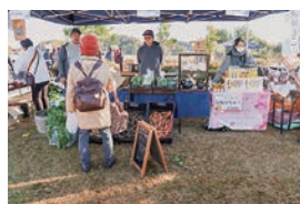
▲ 県内各地域の協力隊のブース