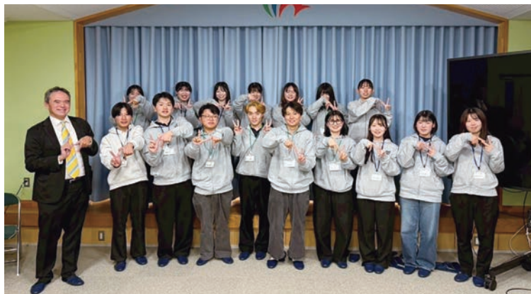
▲「行方市SDGsフィールドワーク2025」茨城大学生と著者