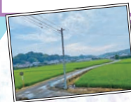
「思い出フォト」 窓から見える夏の景色で す。青々とした稲が風に揺られ、 強い生命力を感じます。