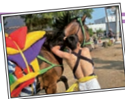
「思い出フォト」 地域の馬出し祭りに、 幼い頃から参加してい ます。