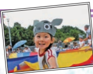
「思い出フォト」 玉造第三保育園の運動 会で踊っているねこ組 (4 歳) の私