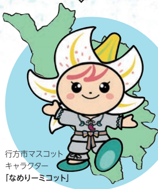
行方市マスコット キャラクター 「なめりーミコット」