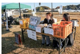
▲ 茨城大学の学生がかぼちゃ販売