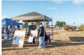
▲ 茨城大学のモルック部の体験コーナー