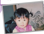
「思い出フォト」 私の小さな頃の写真で す。お人形遊びをする のが好きでした。