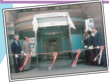
「思い出フォト」 開庁式でテープカット を行いました。

平成 17 年 9 月 2 日、麻生町・北浦町・玉造町の 3 町が合併し、「行方市」が発足しました。令和 7 年 9 月 2 日で、市制施行 20 周年を迎えました。