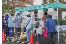
▲ 行方野菜 100円均一を実施