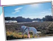
「思い出フォト」 愛犬と日課の散歩。毎 朝見るこの景色が大好き です。