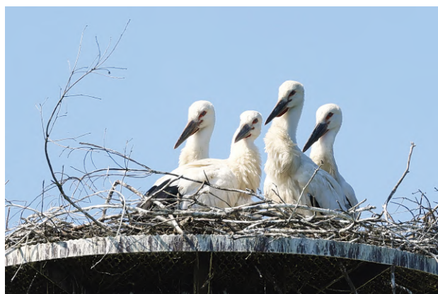
▲ コウノトリのひなたち