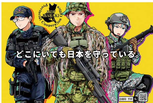
▲ 自衛隊茨城地方協力本部の自衛官募集ポスター