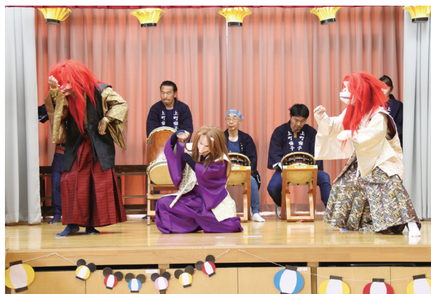
▲ 上町ばやしを披露する上町囃子連の皆さん

7月9日（火）、玉造幼稚園の園行事として、上町囃子連による「夏まつり（上町ばやし鑑賞）」が行われました。上町ばやしとは、旧玉造地区で受け継がれ、毎年5月に開催される大宮神社例大祭で披露されているはやしです。きつね・ひよっこ・おかめ・獅子舞が、笛や太鼓で奏でられる音楽に合わせて踊り、園児たちは楽しそうに鑑賞しました。「上町ばやし」の鑑賞を通じて、地区の歴史や、はやしを受け継いできた人々の思い、地域の良さを園児たちに伝えました。