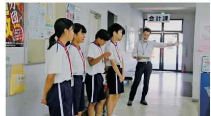
▲写真は、取材時に生徒が撮影したものです。