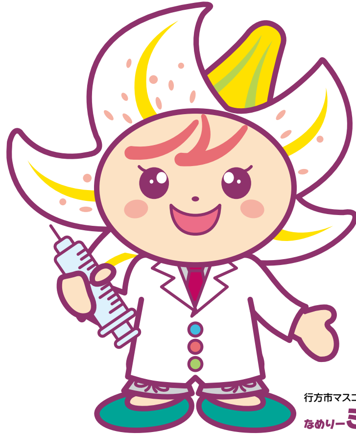
行方市マスコットキャラクター なめりーミコット