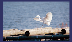
市の鳥 シラサギ (白鷺)