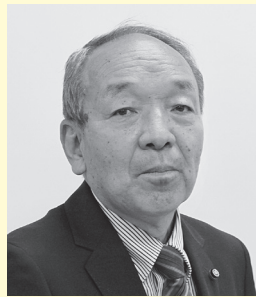
伊勢山 仙寿 議員

答 市民福祉部長 新型コロナウイルス感染症対応地方創生臨時交付金を活用し、子育て世代、非課税世帯、ひとり親世帯等を合わせると、2億8百万円の支出