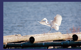
市の鳥 シラサギ (白鷺)