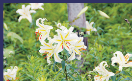
市の花 ヤマユリ (山百合)

行方市民憲章 やさしい自然 かがやく人 わたしたちがつくる 魅力あるまち、行方市