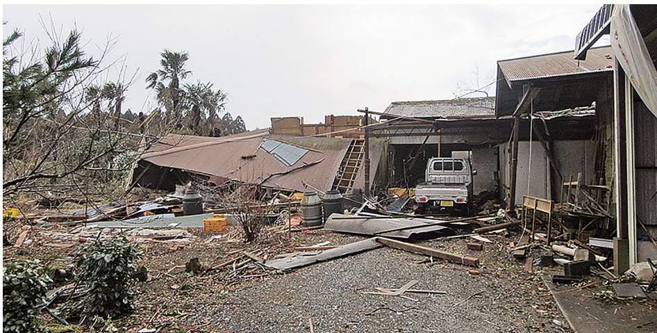
▲平成30年3月に発生した突風被害