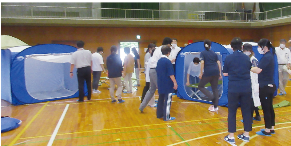
▲避難所開設訓練の様子