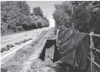
大雨により陥没した路面 (芹沢地内)