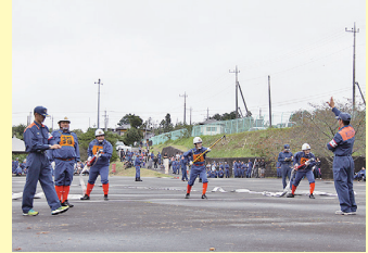
過去に行われた操法大会の様子