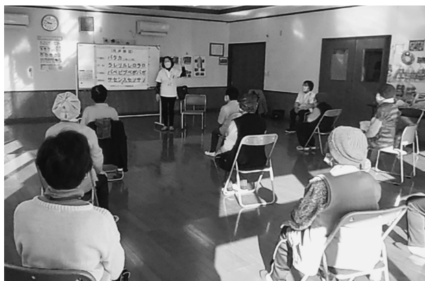
誤嚥 ごえん 予防の体操・発声練習

椅子に座ったり、床に寝たりして行う体操もあるので、体力や身体機能の低下した方でもできるようにつくられています。また、発声練習や、高齢者に多い誤嚥（ごえん）を予防する体操もあります。