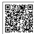
メルカリ Shops 内 行方市ショップページ

SDGs…「持続可能な開発目標」と訳され、2015年の国連総会で採択された。17項目の目標を掲げ、目標の下には、具体策や数値目標などを示した計169のターゲットがある。