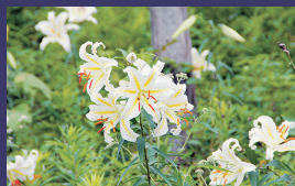
市の花 ヤマユリ (山百合)