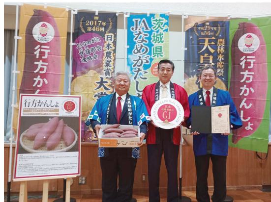
3月31日(金)、農林水産省で登録証授与式が行われました。

食味の良さに加え、通年で実需者からの要望に対し迅速な対応ができる「品種リレー出荷体制」の構築により、京浜市場のみならず、関西等他地域の市場関係者からもその品質と供給体制が評価されており「年間を通して焼き芋を販売するなら、行方かんしょ」といわれるほどに引き合いが強く、東京市場における出荷場単位では取扱量第1位です。地理的表示(GI)としては県内5例目、サツマイモとしては東日本初の登録となりました。