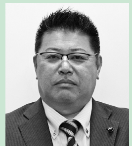
藤崎 仙一郎 議員