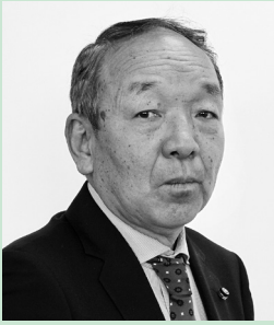
伊勢山 仙寿 議員