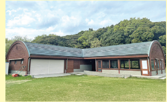
北浦運動場第1グラウンド 休憩所