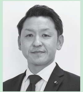
阿部 孝太郎 議員