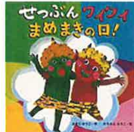
『せつぶんワイワイまめまきの日！』