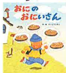
『おにのおにいさん』