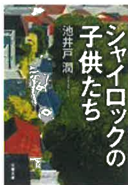
『シャイロックの子供たち』 池井戸 潤/著