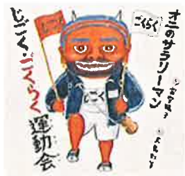
『オニのサラリーマン』