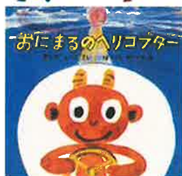
『おにまるのヘリコプター』