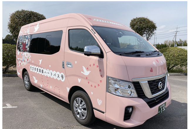
SDGs…「持続可能な開発目標」と訳され、2015年の国連総会で採択された。17項目の目標を掲げ、目標の下には、具体策や数値目標などを示した計169のターゲットがある。

個人がそのニーズによって、自由に移動したり物を移送する権利は、基本的人権の一部とも考えられており、市としては今後も公共交通の利便性向上を図っていきます。