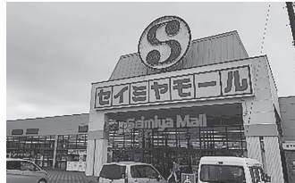
【セイヤマモール麻生店】