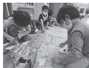
「貨物ターミナルづくり」 ～列車を車庫へ入れたいな～