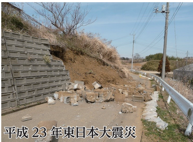
平成 23 年東日本大震災