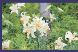
市の花 ヤマユリ (山百合)

行方市民憲章 やさしい自然 かがやく人 わたしたちがつくる 魅力あるまち、行方市