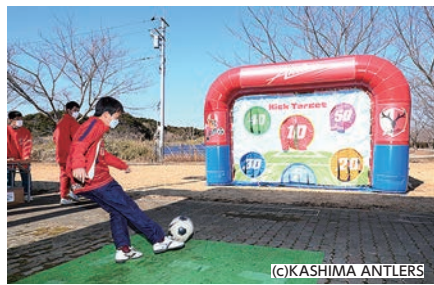
キックターゲット (1回 1人2球 賞品付き)