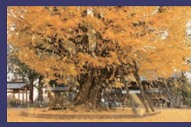
市の木 イチョウ (銀杏)