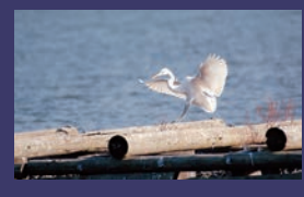
市の鳥 シラサギ (白鷺)