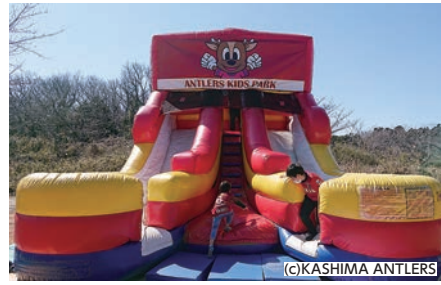
ふわふわスライダー (1回 5分程度)

今月のホームゲーム 【J1リーグ】 ◇5月3日(火・祝) 第11節 ジュビロ磐田 ◇5月14日(土) 第13節 北海道コンサドーレ札幌 ◇5月25日(水) 第15節 サガン鳥栖