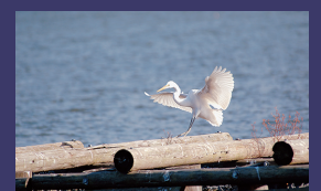
市の鳥 シラサギ (白鷺)