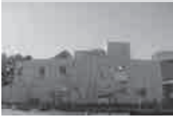
天王崎観光交流センター