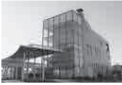
あそふ温泉「白帆の湯」