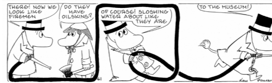
▲ラルス・ヤンソン「10個のブタの貯金箱」原画(1975年)