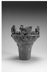
▶国宝「火焔型土器」(十日町市博物館)