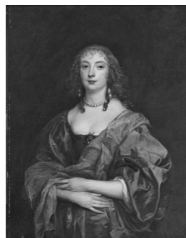
アントニー・ヴァン・ダイク《ベッドフォード伯爵夫人アン・カーの肖像》1639年