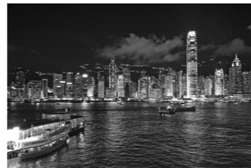
▶香港の夜景

問 茨城空港利用促進等協議会事務局(茨城県政策企画部交通局空港対策課内) ☎029-301-2761