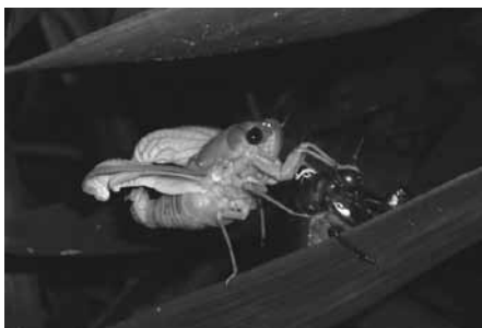
教育長賞 『進化』 平塚 瞳