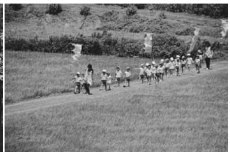
優秀賞 『みんなで歩こう』 柳瀬光子