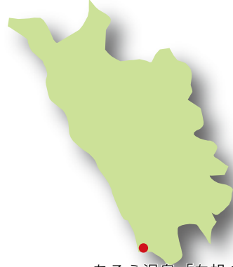
あそ温泉「白帆の湯」