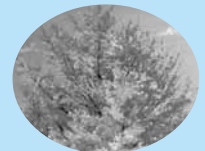
市の木 イチョウ(銀杏)