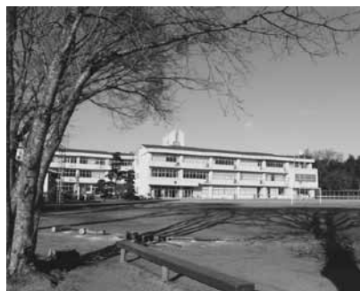
中学校舎を北浦側の統合小として活用

で、一部の学年で1クラスの状況となりますが、他の学年は2クラスで計10クラスとなります。現在の麻生一中の教室は21室ありますが、統合時は普通教室10、特別教室6、学童保育室1を予定しています。その他の教室は、麻生小と同様に交流や連携を行う部屋として利用できるよう考えています。