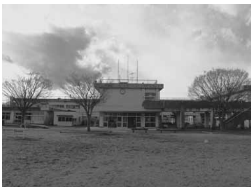
西浦側の統合校として活用する麻生小学校

麻生小の施設の状況は、校舎が昭和49年度から50年度にかけて建設され、面積は4,000平方メートルほどです。鉄筋コンクリート造2階建の棟が3棟あります。体育館は昭和52年度に建設され、鉄骨造で面積は約1,500平方メートルです。