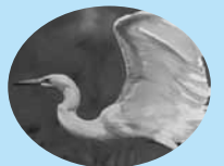
市の鳥 シラサギ(白鷺)