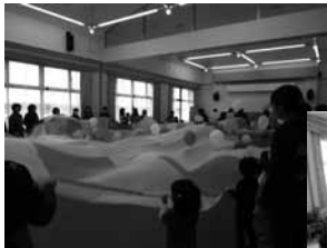
12月16日 親子教室 お茶パーティー ミニミニクリスマス会