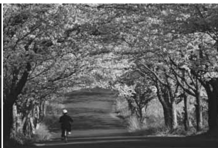
優秀賞 『夢膨らむ』 出沼広志