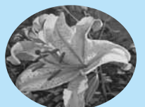
市の花 ヤマユリ(山百合)

章憲市民の方行 やさしい自然 かがやく人 わたしたちがつくる 魅力あるまち、行方市