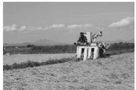
行方市議会議長賞 『収穫の秋』 大輪 章