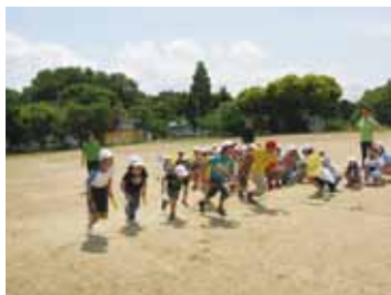
全校生徒班対抗リレー