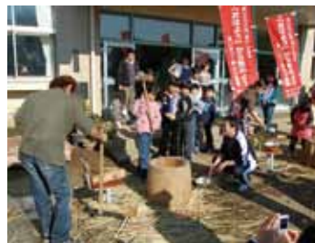
学校と地域が一体となっています

毎年11月には、子ども会育成会とPTAの共催による「三世代餅つき大会」を行っています。どの子も杵を持って餅つきの体験をします。高学年の子は、前日から一緒に準備に取りかかり、調理体験もします。当日は、祖父母の方々も一緒になつて、お手伝いをしてくれます。