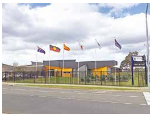
ビクトリア州立ウィングダムセントラルカレッジ

生きた英語を学ぶことはもちろん、現地の人たちとの交流を深めることができ、充実した研修となりました。