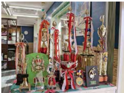
出場した大会で授与された数々のトロフィーやメダル

理容師。県内の理容学校を卒業後、修行期間を経て、家族で営む「Ruana hair TAYAMA (ルアナヘアータヤマ)」に平成26年4月から勤務。趣味は野球。麻生在住。