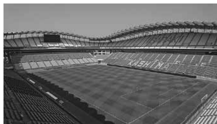
茨城カシマスタジアム