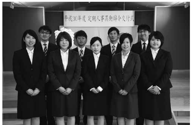
9人の新規採用職員です。これからよろしくお願いいたします。

まだまだ未熟な職員ではございますが、皆さまのお役に立てるよう、努力していく所存です。どうぞよろしくお願ひ申し上げます。