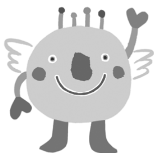
愛称:いばラッキー

今回、この花を北浦第1グラウンドに飾り「市民運動会」や「ゲートボール大会」等で多くの市民の皆さんに見ていただいています。また、プランターには、茨城国体に向けた中学生からのメッセージが書かれています。