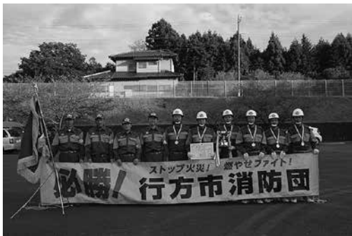
自動車ポンプの部優勝 繁昌消防団