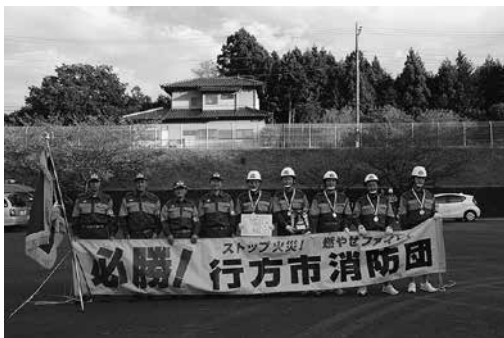
小型ポンプの部優勝 三和消防団