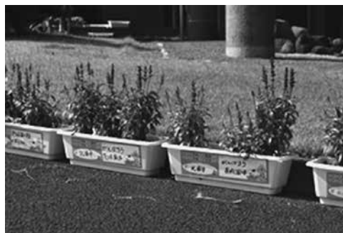
立派に育ちました

プロフィール ○ はるか未来に、幸運のエネルギーできたラッキー星がある。その星のかけらが弾けて、地球の茨城にやってきた。 ○ 茨城（イバラ）は、ラッキー星と名前がちよっと似ていてすーっと気になっていた。 ○ みんなに幸運を届けたいのが大好きで、好奇心が旺盛！顔にあるアンテナで幸運の届け先をいつも探している。 ○ 手を振ると左手の緑のハートからは「夢を描くパワー」を、右手のオレンジのハートからは「勇気のパワー」を発することができる。 ○ 頑張っているひとを見るとアンテナが反応！背中の翼でどこへも行って、輝くみんなに夢と幸運を届けます！