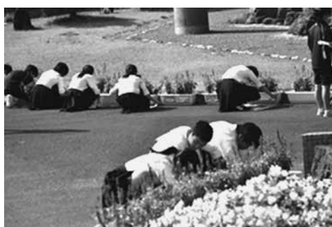
プランターにシールを貼る生徒たち