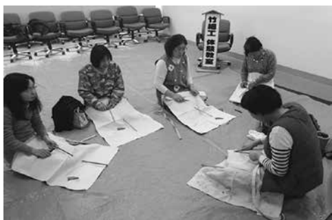
竹細工体験教室(2/26)でおはし作りに挑戦した参加者