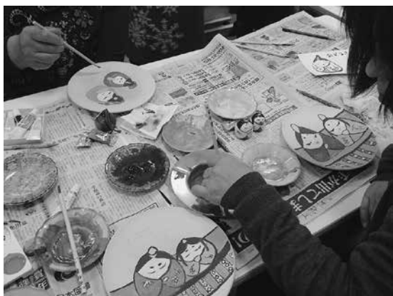
おひな様絵付けを楽しむ参加者

併せて、牛乳パック創作体験や家庭排水協等の協力による「良く落ちるアクリルたわし」作りなどの環境保全運動も行われました。