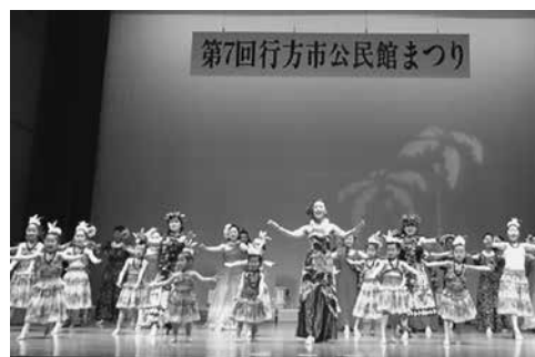
2/25「踊りの祭典」～華やかなフラのフィナーレ～