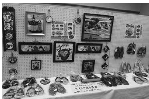
平成28年度の公民館講座の力作を展示

北浦公民館では、公民館講座の受講生が作った作品のほか、利用団体等の作品等を展示しました。また、体験教室や模擬店が開催され、たいへん賑わいました。文化会館では25日に「踊りの祭典」が、26日に「音楽のつどい」が開催されました。