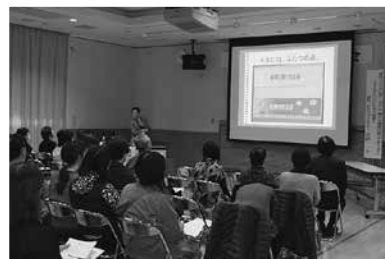
北折一氏による 「健康づくり講演会」