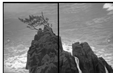
唐招提寺御影堂障壁画 瀟声(部分) 昭和50年 唐招提寺蔵