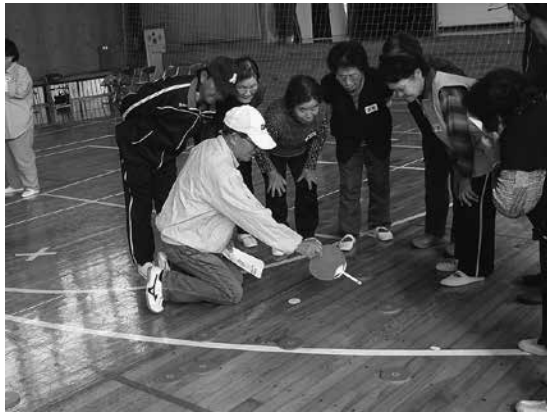
ニュースポーツ体験教室にて「ディスコン」