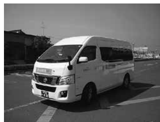
実際に運行している「行方ふれあい号」