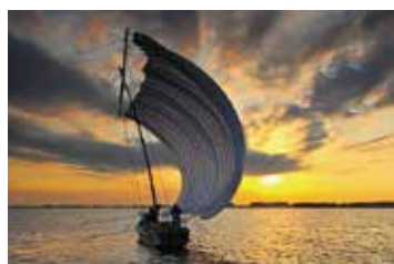
行方市の宝だから… 未来につないでいきたい、霞ヶ浦に浮かぶ帆引き船

市民の皆さんにおいても、ふるさと納税に対する、ご理解・ご協力をお願いいたします。