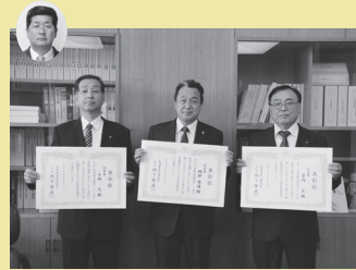
右から宮内議員・岡田議員・小林議員 左上、関野前議員