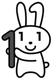
マイナンバーロゴマーク マイナちゃん

【受付時間】 平日 午前9時30分～午後5時30分(土・日・祝日、年末年始を除く)