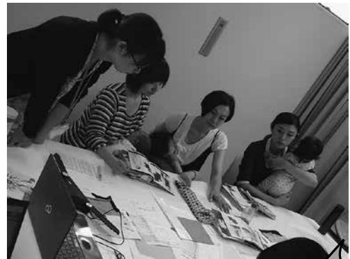
子連れでの会議風景

一人ではなく、二人三脚、いえ、もっと多くの人が関わりながら子育てをする、子育てをみんなで共有するということは、どんなに子育てを楽にするでしょうか。そんな楽しい子育ての姿を見せることは、次世代の若者や子どもたちに、明るい未来を見せることになります。まさに、子育て自体が社会貢献になるのです。