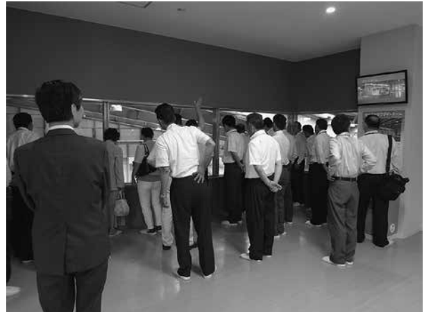
芳賀地区エコステーション視察状況

また、第9回の委員会では、平成26年4月に稼働した栃木県の芳賀地区エコステーションを視察し、最新のごみ処理やリサイクルにおける公害を出さないごみの安定処理について見識を広めました。