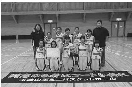
↑玉造山王ミニバス