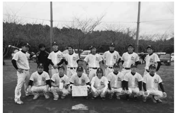
↑ 零 - zero -