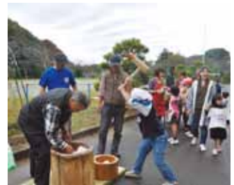
地域の方との餅つき

本校は、三世代交流を目的としたお楽しみ学習会を行っています。マーチングバンドを依頼したり、学校以外の施設を利用したりと、毎年保護者の皆様と教職員が何度も話し合い、楽しい1日が過ごせるように計画しています。 今年も閉校なので、行方小学校に十分浸つてもらおうと、11月19日の土曜日の夜は保護者の方と体育館に宿泊し、20日の日曜日は地域の方と餅つきをして、みんなで楽しく会食をすることができました。 夜中に体育館の屋根から聞こえる雨音を布団に入りながら静かに聞いた経験や、みんなでついた餅を地域の方と楽しく食べた経験は、貴重なものとなりました。また、地域の方がたくさん集まるということで、5年生が総合的な学習の時間に、地域の方に「指導・協力」をいただきながら作った八俣のもち米を販売しました。収穫までの苦労と売上の喜びを体験できたことは、働くことの意義を理解することに繋がりました。