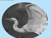
市の鳥 シラサギ(白鷺)