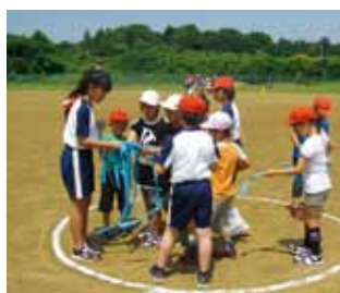
縦割り班活動で行うフェスティバル

本校は、東日本大震災による被災で、現在、小貫小学校と共に北浦中学校の施設を借りて生活しています。4月当初は、新しい環境に戸惑う児童も見られましたが、現在は、みんな元気に生活しています。 北浦中学校や小貫小学校の多くの児童生徒とふれ合う中で、思いやりのある児童の育成に努めています。 全校児童数は37人で、3年と5・6年が複式学級の4学級の学校です。小さな学校ですが、素直で明るく活発な子ども達です。 少人数に対応した縦割り班活動を本校の教育活動の中心に据え、高学年のリーダーシップの下、協力し合いながらのびのびと生活しています。