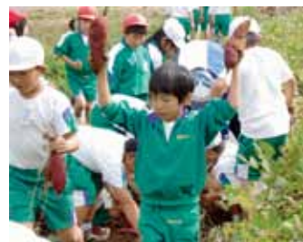
大きなさつまいもを収穫

明朗、素朴でよく働く 子どもたち 本校は、創立130年以 上を誇る歴史があります。 地域の方々は大変教育熱 心、協力的です。子どもた ちは行動的で、朗らかに活 動しています。また、明朗・ 素朴でよく働く子が多く、 係や清掃なども進んで活動 しています。さらに、今年 度は、人の話を真剣に聞き、 わかりやすく話すこと、い つでも明るいあいさつ、元 気な返事、学校や社会のき まりを守り、思いやりをも つことを伸ばしたいと考え ています。 この度の東日本大震災に より、北浦中学校の敷地内 に移転しました。しかし、 行事等で萎縮することな く、この壁を乗り越えよう と職員と子どもたちがのび のびとそして、一つになっ て、日々取り組んでいます。 ご声援の程をお願い申し上 げます。