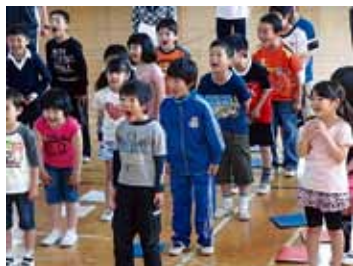
群読は発声練習からスタート