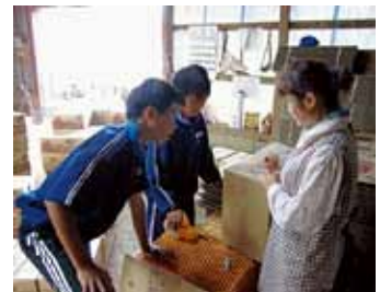
地域を支える農業を体験

本校では、若葉輝く6月に体育祭を実施しています。学級対抗の競技に加え、学年や学級の枠を越えた分団を結成していくつかの競技を行うことで、学級だけでなく学校全体の団結も深まり、協力が育っています。親子競技が全学年で実施され、家族で昼食をとる時間もあるので、親子がふれあうよい機会にもなっています。